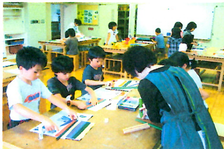
【おもしろ造形教室】