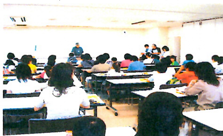
【おもしろ理科教室】

子どもたちに充実した放課後を過ごしてもらおう目的で「青少年の家」でこの活動をスタートした。 第1・3水曜日「おもしろ理科教室」第2・4水曜日「おもしろ造形教室」「お琴で遊ぼう」