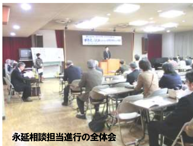
永延相談担当進行の全体会