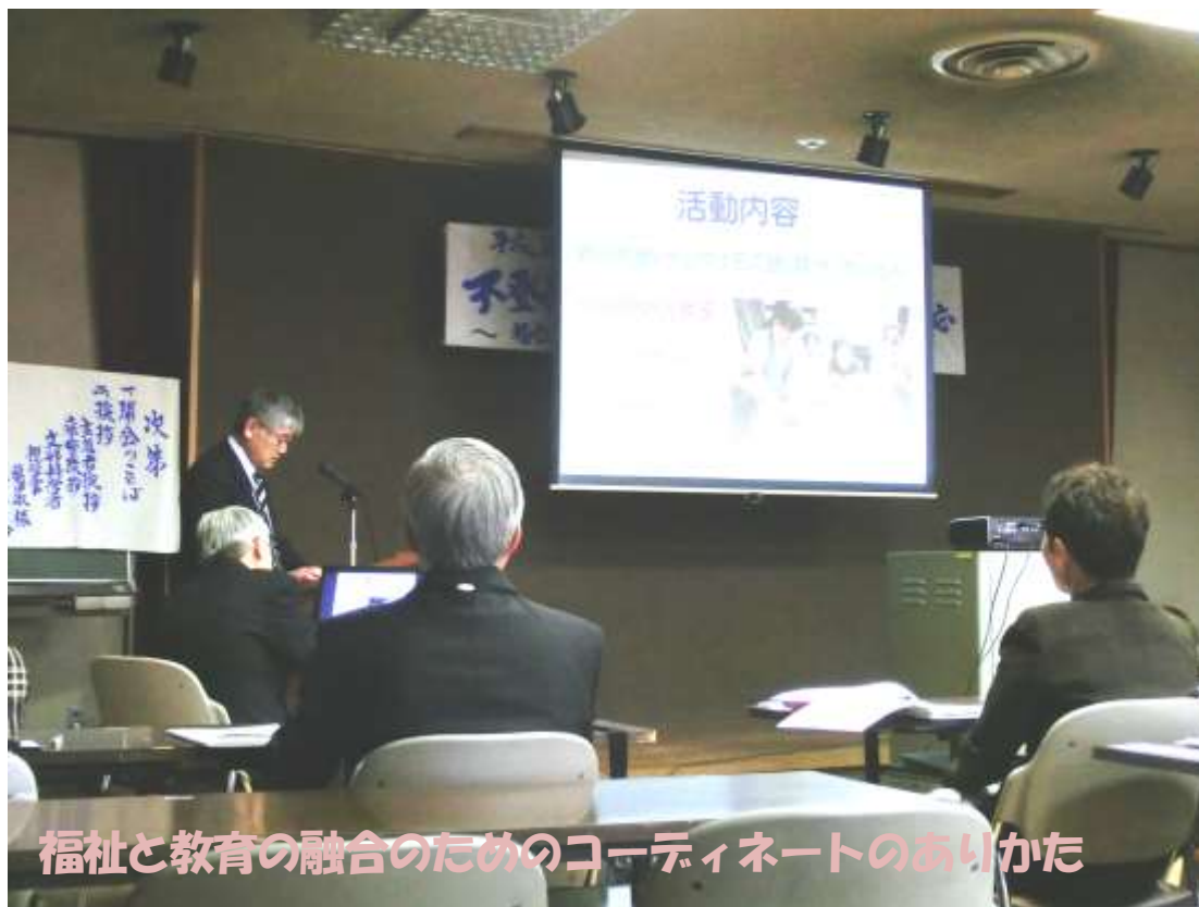
福祉と教育の融合のためのコーディネートのありかた

2月28日(土)川崎市教育会館に於いて平成26年度文部科学省委託研究報告会が開催された。