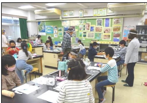
ペーパークロマトグラフィーで 色のふしぎを調べよう