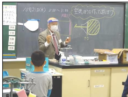
空気ほうを作って遊ぼう